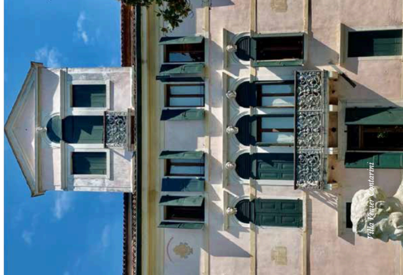
Villa Venier Contarini

Ville Venete - Luoghi di delizie e di primizie.