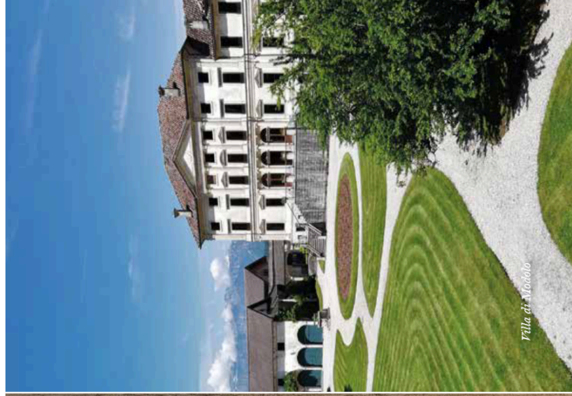
Villa di Modolo

Agricoltura, la via tortuosa alla sostenibilità.