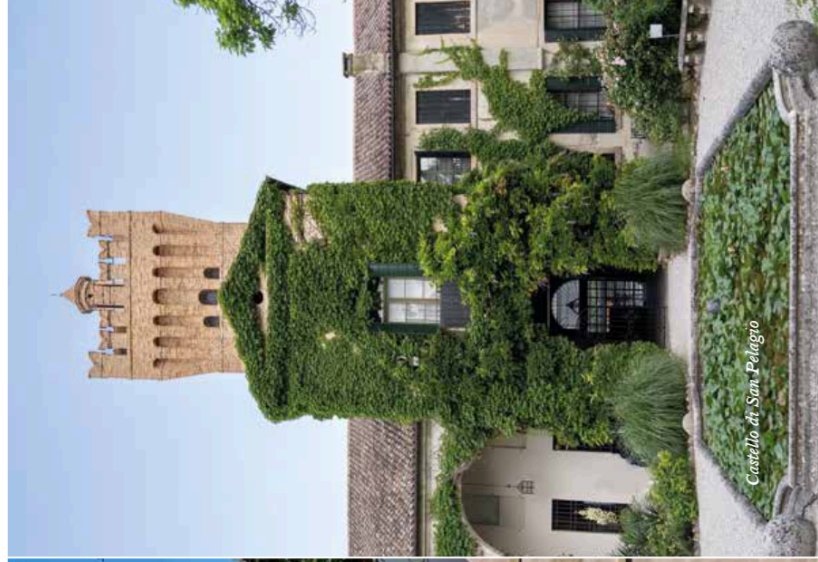
Castello di San Pelagio

Le parole come cura e memoria di ogni genius loci.