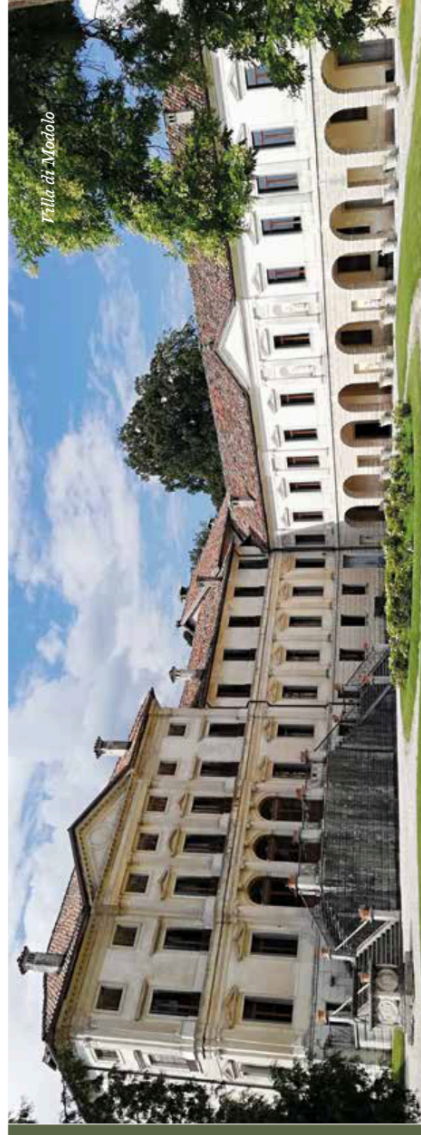
Villa di Madole

L'Ufficio Scolastico Regionale per il Veneto, di seguito denominato USRV, con sede a Venezia, è organizzato in uffici dirigenziali di livello non generale per funzioni e per articolazioni sul territorio, con compiti di supporto alle scuole, amministrativi e di monitoraggio, in coordinamento con le direzioni generali competenti del Ministero, così come disposto dal DM n. 925 del 18 dicembre 2014.